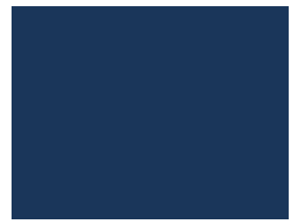
6008 BLUE (GS)